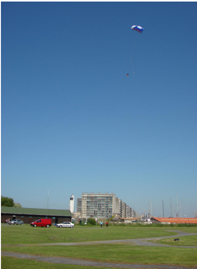
Flow Power Sled, SW 4,5m in BLANKENBERGE, BE

Die abgestrahlte Leistung beider Sender betrug je 100 Watt. Die Sende- und Empfangsrapporte betragen bei beiden Radiostationen beeindruckende RS 59+20dB.