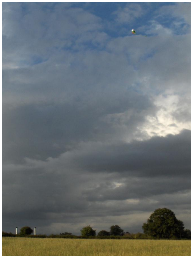
Aerostat mit Heliumfüllung in Kidderminster, GB