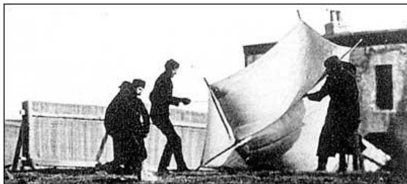
Marconi's group struggling to get an antenna kite into the air. Signal Hill, St. John's Newfoundland, December, 1901.

Es muss damals an diesem Tag eine kräftige Brise geherrscht haben um mit dieser Größe Drachen einen 122m langen Draht am Himmel zu verankern. Das Bild zeigt Marconi's Helfer in ihrem Bemühen den Drachen in die Luft zu bekommen.